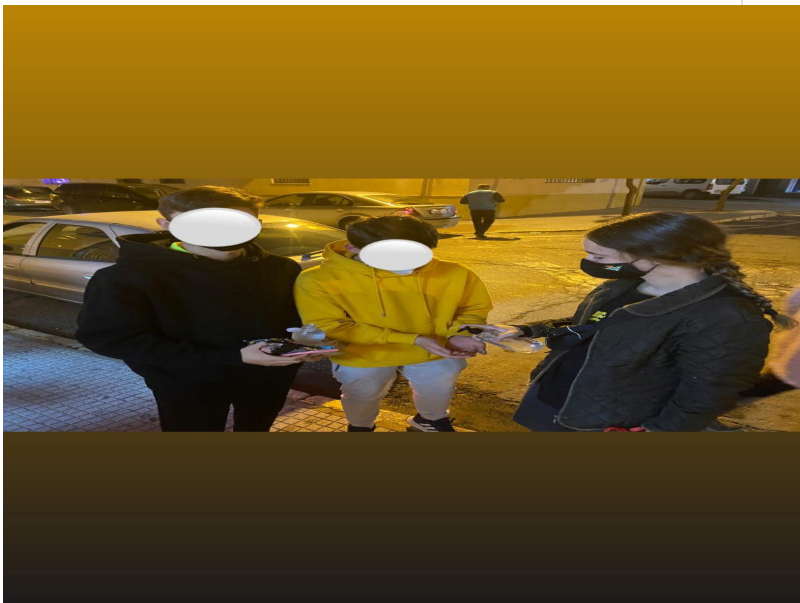
( http://www.rocianadelcondado.es/export/sites/rociانا/es/.galleries/noticias/Noticias-2020/equipo-covid2.jpg )