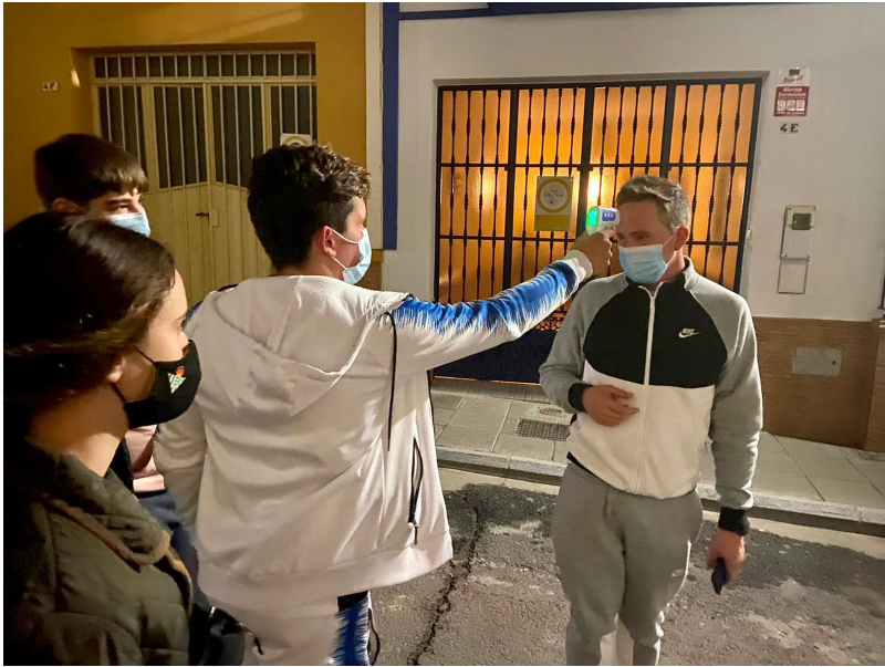
( http://www.rocianadelcondado.es/export/sites/rociانا/es/.galleries/noticias/Noticias-2020/equipo-covid1.jpg )