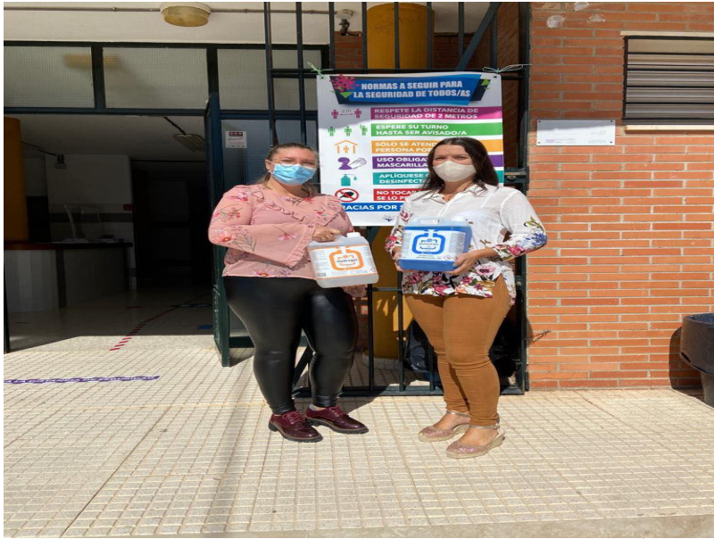
( http://www.rocianadelcondado.es/export/sites/rociana/es/.galleries/noticias/Noticias-2020/reparto4.jpg )