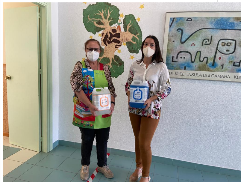
( http://www.rocianadelcondado.es/export/sites/rociana/es/.galleries/noticias/Noticias-2020/reparto5.jpg )