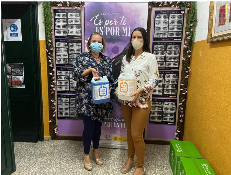
( http://www.rocianadelcondado.es/export/sites/rociana/es/.galleries/noticias/Noticias-2020/reparto.jpg )