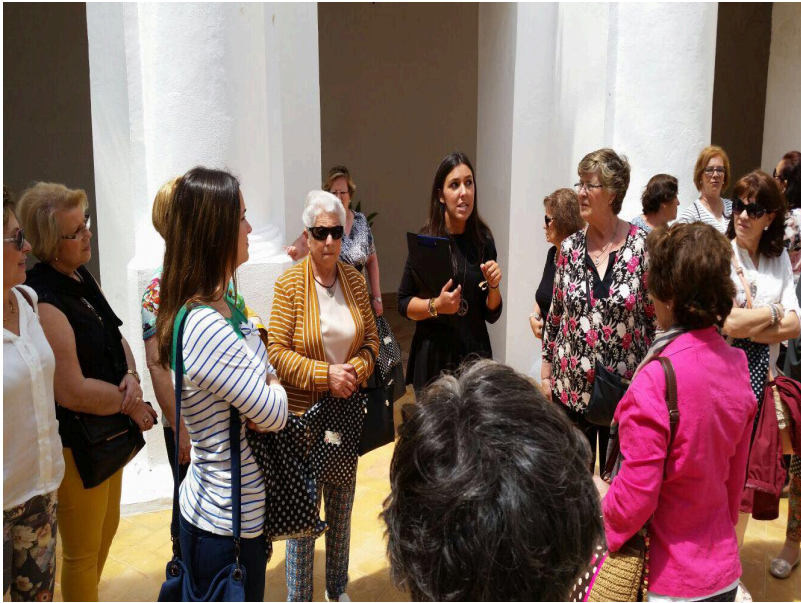
( http://www.rocianadelcondado.es/export/sites/rociana/.galleries/Convivencia3.jpg )