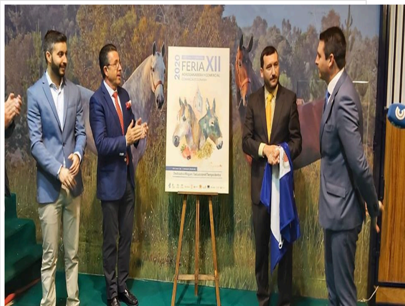
( http://www.rocianadelcondado.es/export/sites/rociana/es/.galleries/noticias/Noticias-2019/feria-agro1-2.jpg )