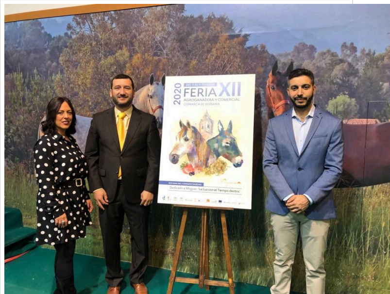
( http://www.rocianadelcondado.es/export/sites/rociana/es/.galleries/noticias/Noticias-2019/feria-agro1-4.jpg )

Gracias a la empresa El Molino por cedernos su stand para dicha presentación y desde hoy, empezaremos a desvelar las novedades que traerá esta XII edición.