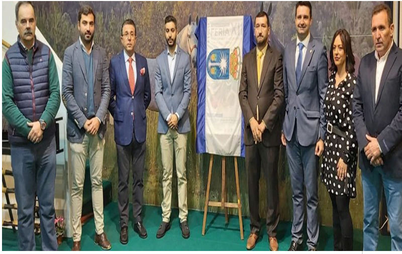
( http://www.rocianadelcondado.es/export/sites/rociana/es/.galleries/noticias/Noticias-2019/feria-agro1-1.jpg )